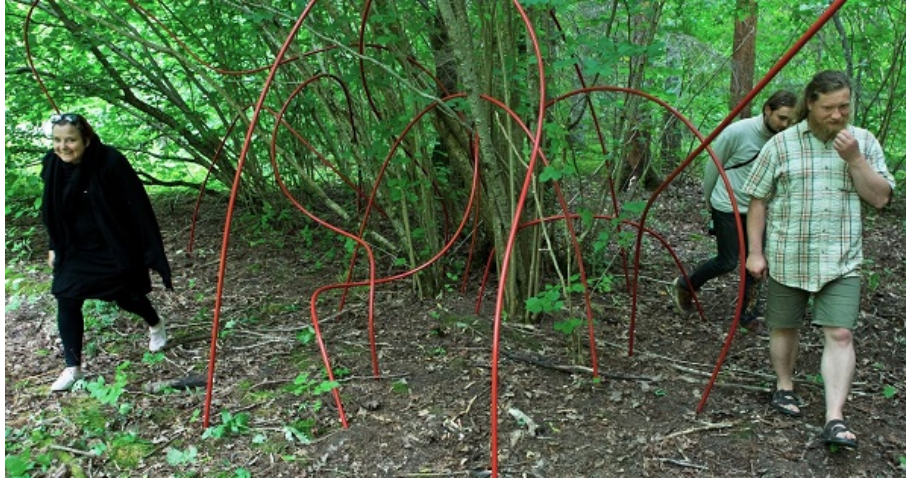
TAKK maastikukunsti sümposium, 2022